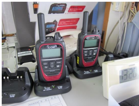
I P 無線機の導入