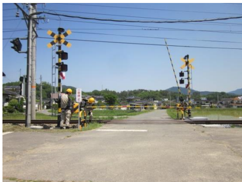
中丸田農道 4 号踏切道の格上げ

今後も他社線で発生した事故事例を自社での事例として置き換え、現在の状況を検証、必要により見直すことで同種事故の再発防止を図るなど、安全の確保に努めてまいります。