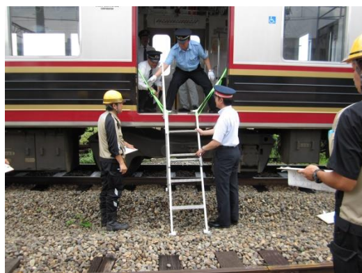
異常時運転訓練 (避難誘導訓練)

また、信号故障を想定し 3 月 13 日、14 日に模型を使った、指導通信式の訓練を実施いたしました。