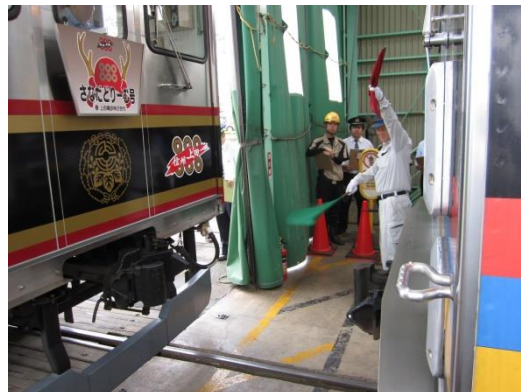
(救援列車連結訓練)