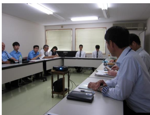
毎月開催している業務研究会

役職員相互の双方向コミュニケーションを踏まえた社長・安全統括管理者・運転管理者等による職員との面談や意見交換会の実施、現場会議への参加などにより、職場環境の改善や安全意識の向上を図っております。