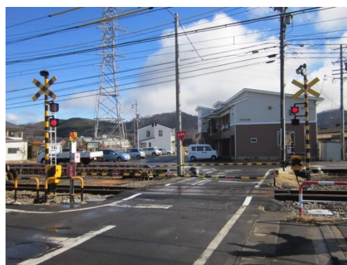
西原田農道踏切道の機器更新