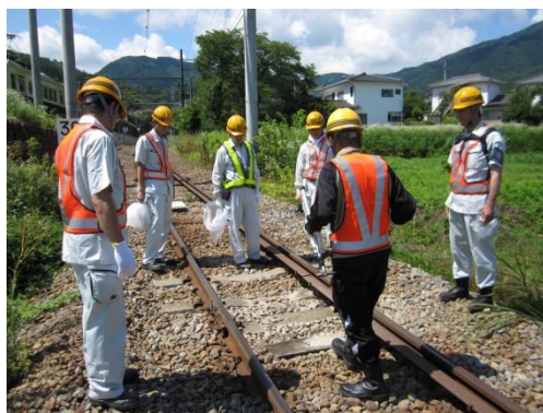
夏季社長安全巡視