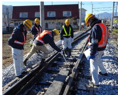
年末年始輸送安全総点検・安全巡視