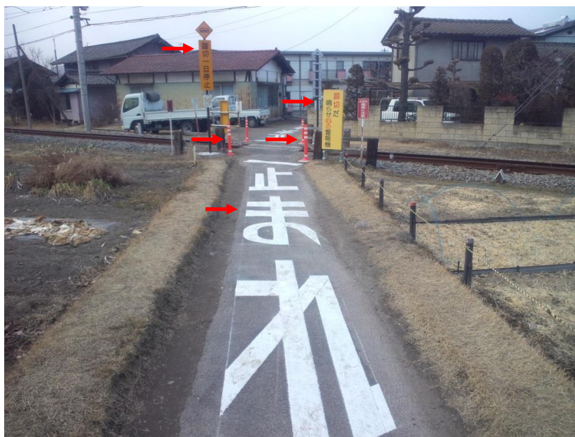
（踏切事故防止対策）

平成26年2月14日からの大雪により、積雪量が約80cmとなったため平成26年2月15日初電から全線で運休となり、多くの方々に大変ご迷惑お掛け致しました。16日未明からモーターカーによる除雪、人力による駅、踏切の除雪を行い、16日18時38分全線で運転再開いたしました。除雪作業を社員一丸で行い、早期に復旧できたことで、お客様の影響を最小限にできました。