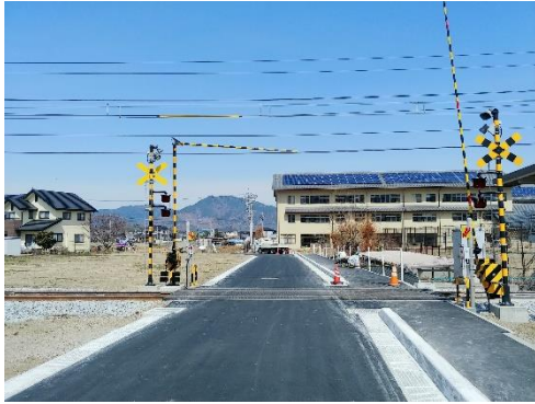
新田農道 1 号踏切道の拡幅