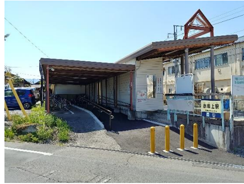
赤坂上駅スロープ設置