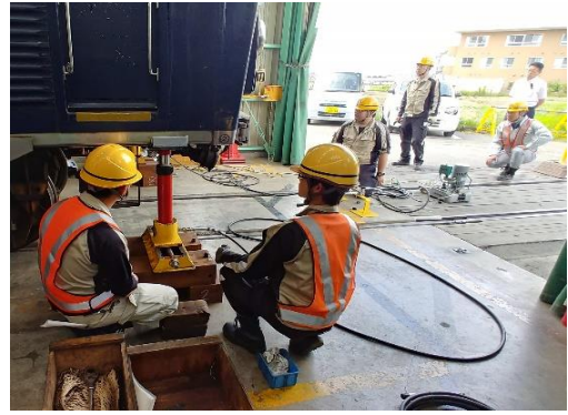
脱線復旧訓練（油圧ジャッキ操作）