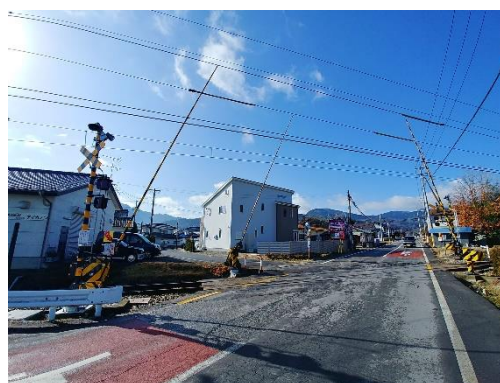
天神前踏切道の機器更新