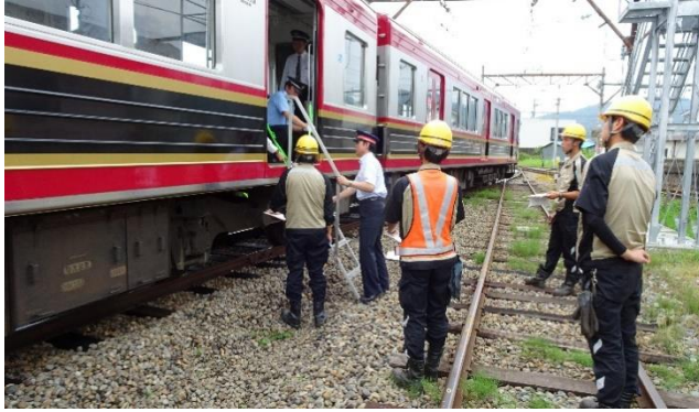
異常時運転取扱訓練（避難誘導訓練）