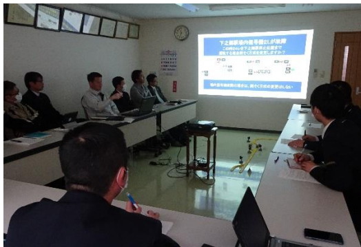
指導通信式運転教育