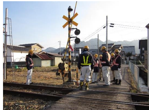
年末年始輸送安全総点検・安全巡視