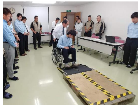
「介助・見守り」の教育