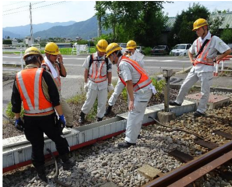
夏季社長安全巡視